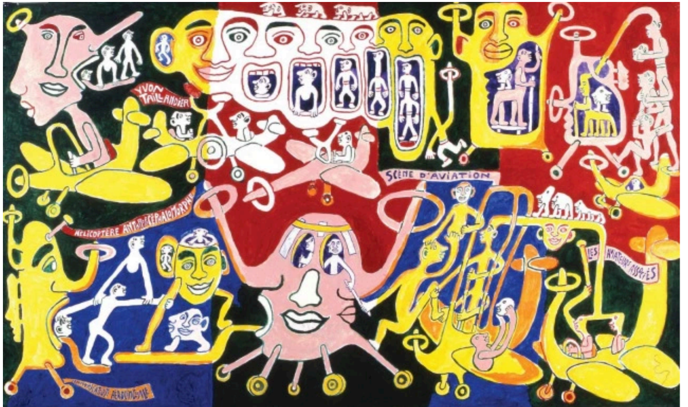
Collection C eres Franco. The exhibition space