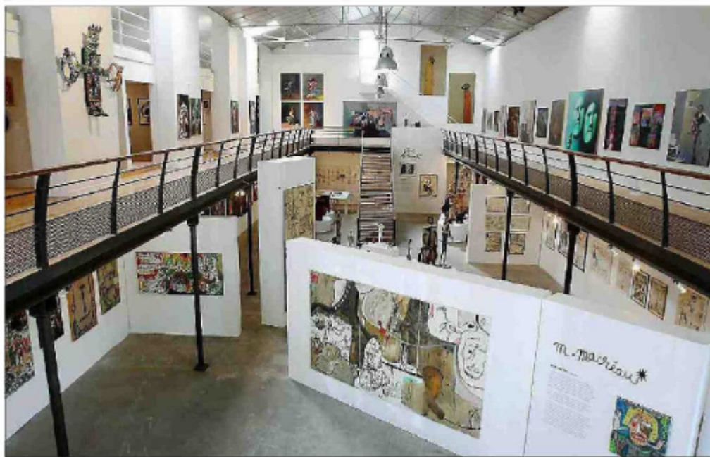
149 toiles de Michel Macréau et Stani Nitkowski sont actuellement exposées à la cave coopérative de Montolieu.

Cette exposition visible à Montolieu, dévoile au public des toiles de la collection Cérés Franco où peintures et écritures s'entrelacent.