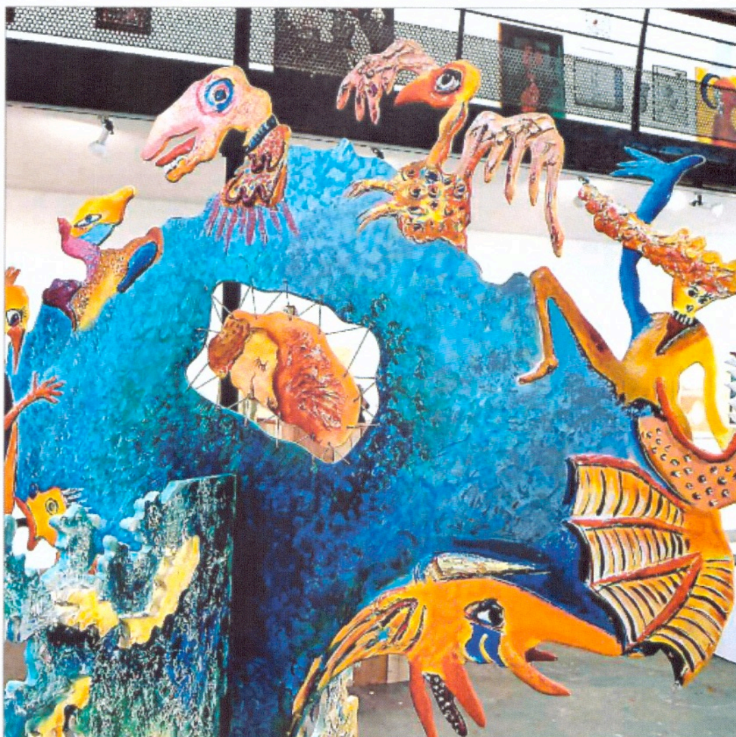
► L'exposition est visible jusqu'au 5 novembre à la coopérative, à Montolieu.